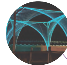
過去作品 緊張の糸